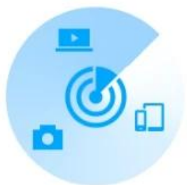
Home Network Scanner