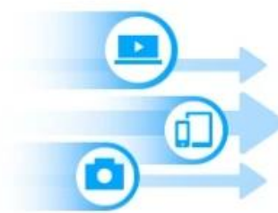
Quality of Service